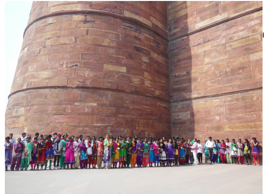
Viajeras, aventureras y con hambre de