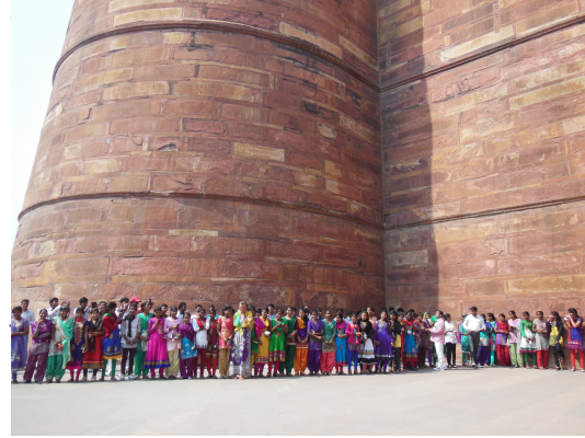
Viajeras, aventureras y con hambre de