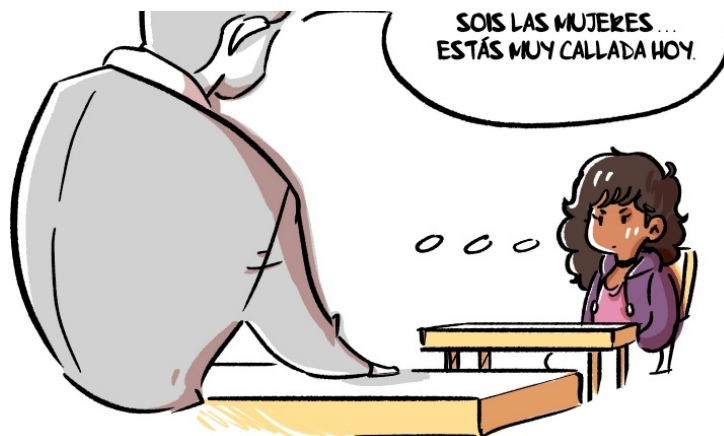
Acoso por razón de sexo

Se pueden incluir también los cuadernos de opinión en línea.